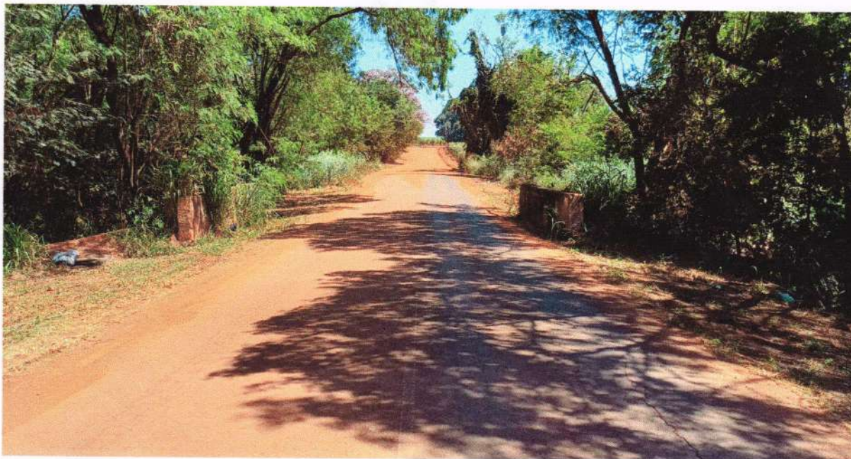
Figura 01 - Vista do local ilustrando as laterais de uma ponte, sentido zona rural que gera insegurança para os que utilizam daquela via.

LOCAL FOTOGRAFADO AOS 26/04/2026 - POR VOLTA DAS 12h10Min., FINAL DA AVENIDA JOSÉ GARCIA JUNQUEIRA - CORREGO S. QUITERIA / GUAIRA/SP.