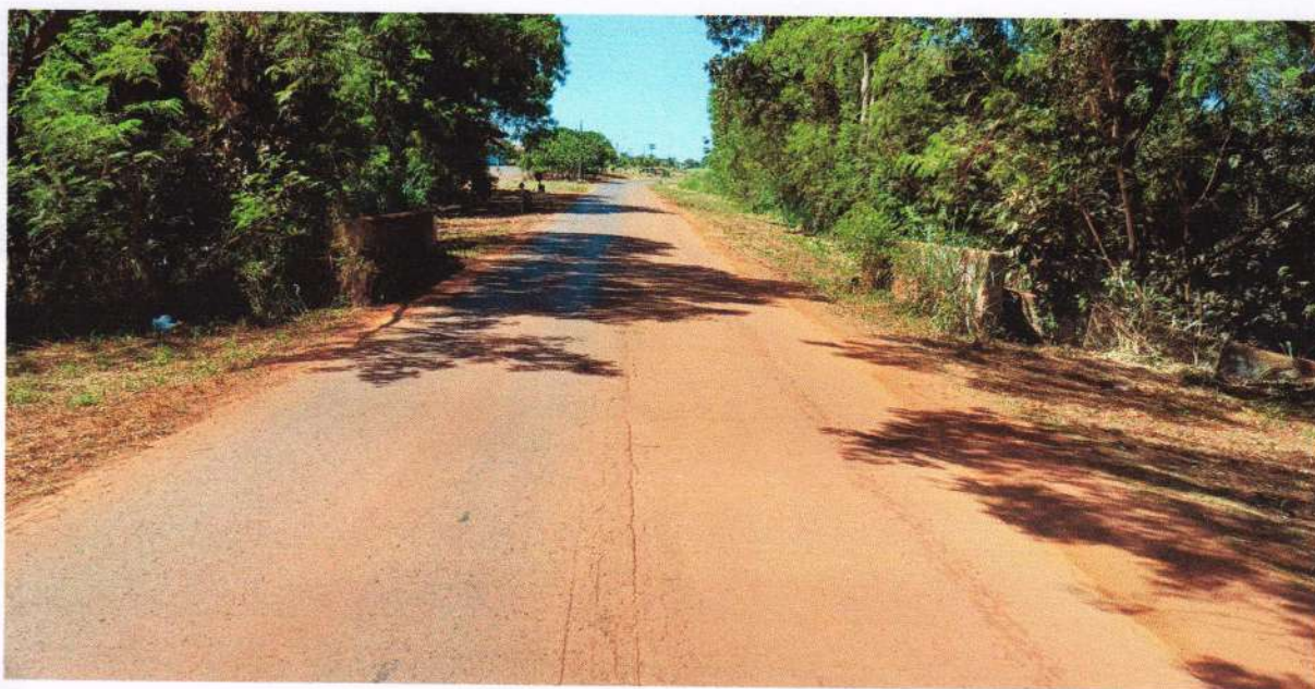
Figura 02 - Vista do local ilustrando laterais da ponte, sentido perimetro urbano onde necessita de reparos e instalação de equipamentos de segurança.