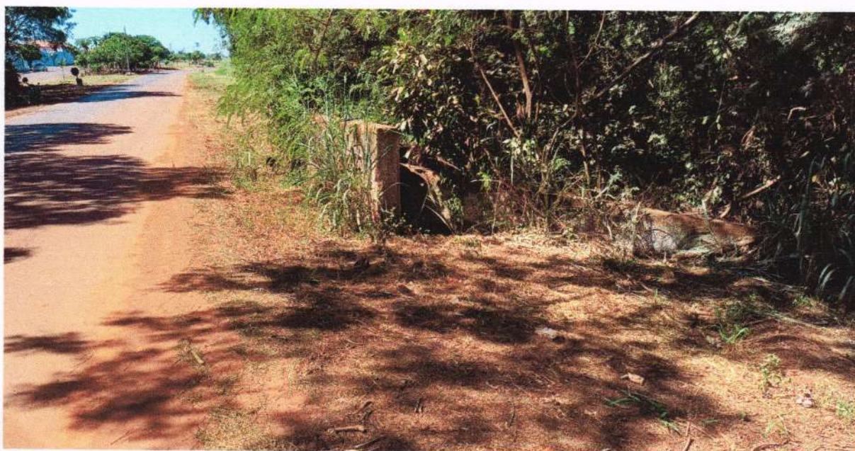
Figura 04 - Vista do local ilustrando uma das laterais da ponte, a qual necessita da sinalização adequada, para gerar as atenções necessárias aos que lá trafegam