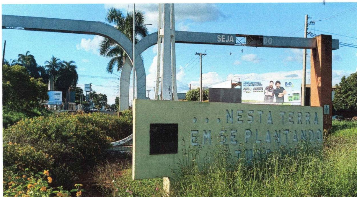
Figura 01 - Vista do local ilustrando a necessidade de melhorias no monumento de recepção aos visitantes ao perímetro urbano da nossa cidade.

LOCAL FOTOGRAFADO AOS 28/01/2026 - POR VOLTA DAS 16H10MIN., BAIRROS INDUSTRIAL / PORTAL DO LAGO B / GUAÍRA/SP.