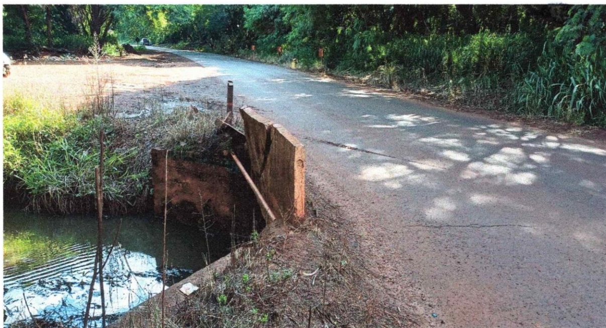
Figura 01 - Vista do local inlstando uma das laterais de uma ponte, que gera insegurança para os que utilizam daque via.

LOCAL FOTOGRAFADO AOS 24/01/2026 - POR VOLTA DAS 16H15MIN., ESTRADA ANTENOR CARLOS NOGUEIRA SOBRE O CORREGO PANTANA / GUAÍRA/SP.