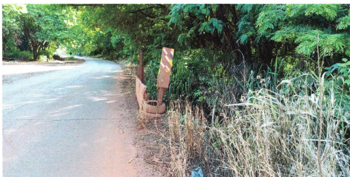
Figura 02 - Vista do local ilustrando lateral da ponte, onde necessita da instalação de equipamentos de segurança.